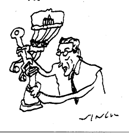
LA 3° CARICA DELLO SCARICO